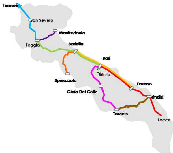
Figura 1 I servizi regionali Trenitalia su rete ferroviaria RFI in Puglia, con integrazione della nuova linea Bari-Bitritto ( in fase di rilascio da parte del gestore )

Il servizio si concentra principalmente sulla dorsale adriatica da Termoli a Lecce, alla quale sono connesse le linee afferenti Barletta-Spinazzola, Foggia-Manfredonia, Bari Centrale-Taranto e Brindisi-Taranto.